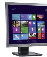
HP EliteDisplay E190i LED (Ref.: E4U30AA)