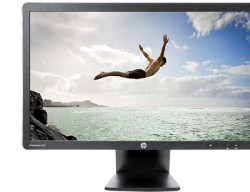
HP EliteDisplay E231 LED (Ref.: C9V75AA)