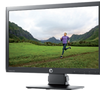
HP EliteDisplay E201 LED (Ref.: C9V73AA)