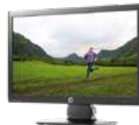
HP EliteDisplay E201 LED (Ref.: C9V73AA)