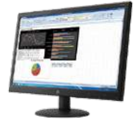
HP V241p (Ref.: KOQ34AA)

UC758E. HP Care Pack ampliación 3 años pick & return