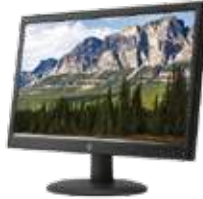
HP V201a (Ref.: F8C55AA)

U0VM5E. HP Care Pack ampliación a 3 años