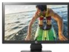
HP ProDisplay P221 LED (Ref.: C9E49AA)