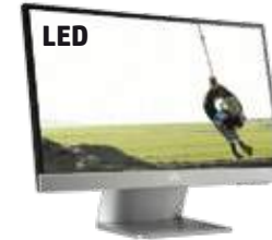
Pavilion 22xi (Ref.: C4D30AA)