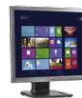
HP EliteDisplay E190i LED (Ref.: E4U30AA)