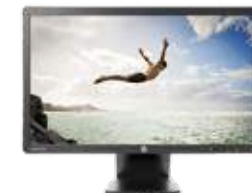
HP EliteDisplay E231 LED (Ref.: C9V75AA)