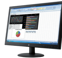
HP V241p (Ref.: K0Q34AA)