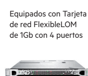
LIQUIDACIÓN DE EXISTENCIAS ProLiant DL360e Gen8 v2