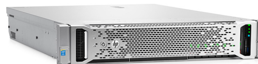
ProLiant DL380 Gen9