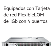
LIQUIDACIÓN DE EXISTENCIAS ProLiant DL360e Gen8

NUEVOS PROCESADORES Intel® Xeon® E5-2400v2