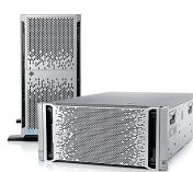
LIQUIDACIÓN DE EXISTENCIAS ProLiant ML350p Gen8 v2