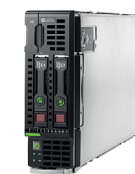
ProLiant BL460c Gen9