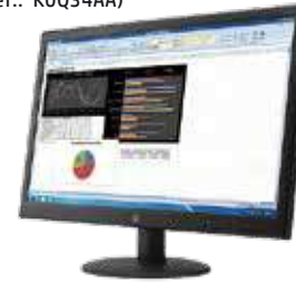
HP V241p (Ref.: K0Q34AA)