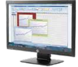
HP ProDisplay P222va LED (Ref.: K7X30AA)