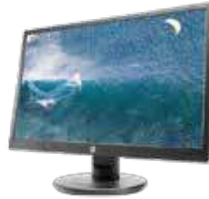
HP V212a (Ref.: M6F38AA)