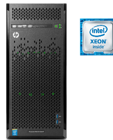
ProLiant ML110 Gen9