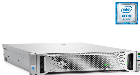
ProLiant DL180 Gen9