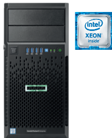
ProLiant ML30 Gen9