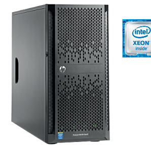
ProLiant ML150 Gen9