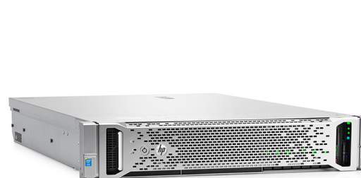
ProLiant DL380 Gen9