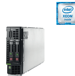
ProLiant BL460c Gen9