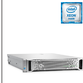
ProLiant DL180 Gen9