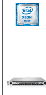
ProLiant DL360 Gen9