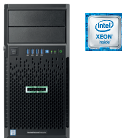
ProLiant ML30 Gen9