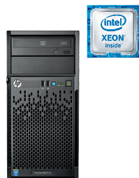
ProLiant ML10 Gen9