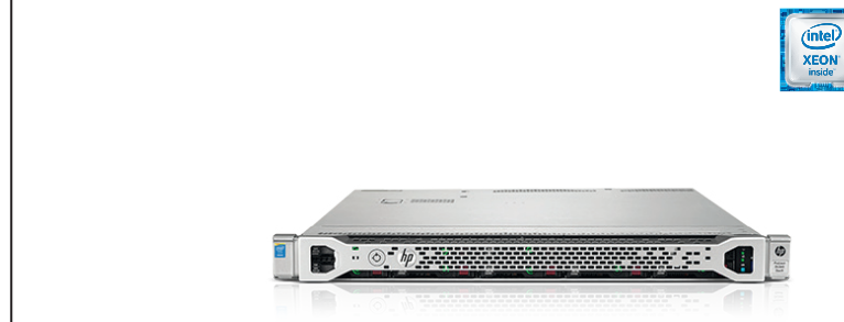
ProLiant DL360 Gen9