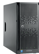
ProLiant ML150 Gen9