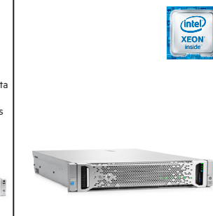
ProLiant DL380 Gen9