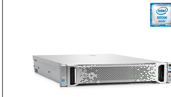
ProLiant DL180 Gen9