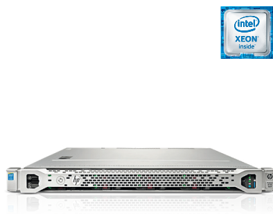
ProLiant DL160 Gen9