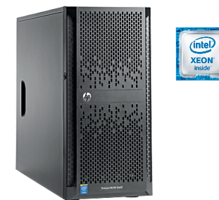
ProLiant ML150 Gen9