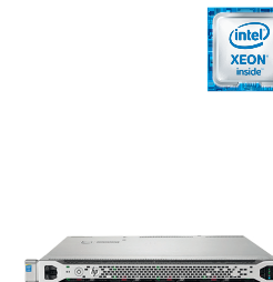
ProLiant DL360 Gen9