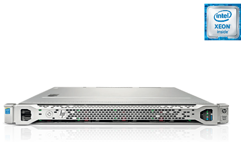
ProLiant DL160 Gen9