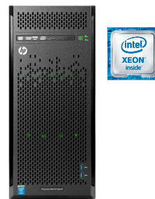
ProLiant ML110 Gen9