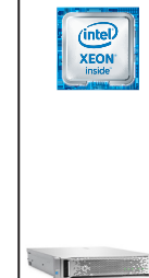
ProLiant DL180 Gen9