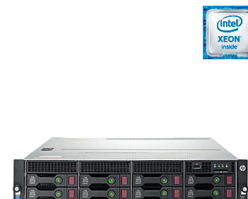
ProLiant DL80 Gen9