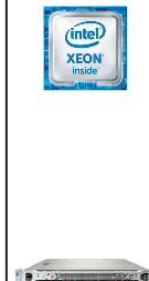
ProLiant DL160 Gen9