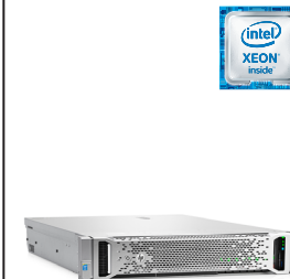
ProLiant DL380 Gen9