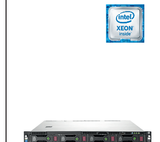
ProLiant DL120 Gen9