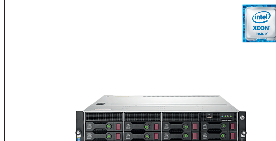
ProLiant DL80 Gen9