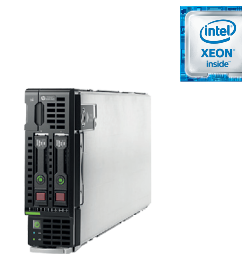
ProLiant BL460c Gen9