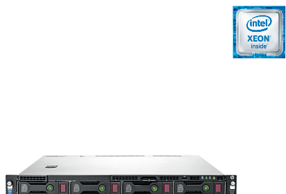
ProLiant DL60 Gen9