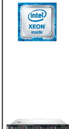
ProLiant DL60 Gen9