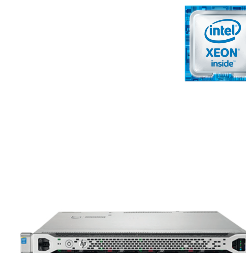
ProLiant DL360 Gen9