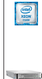
ProLiant DL180 Gen9