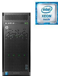
ProLiant ML110 Gen9