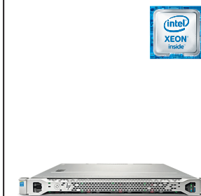
ProLiant DL160 Gen9