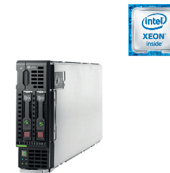
ProLiant BL460c Gen9