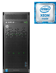
ProLiant ML110 Gen9