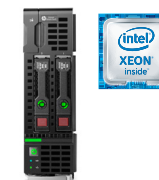
BL460C Gen9 Ref.: N1W94A