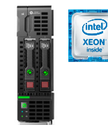
BL460C Gen9 Ref.: N2G74A