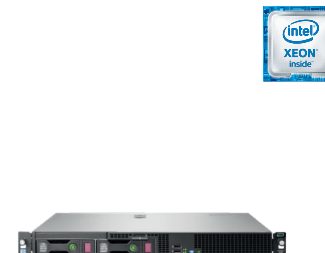
ProLiant DL20 Gen9