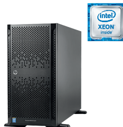
ProLiant ML350 Gen9