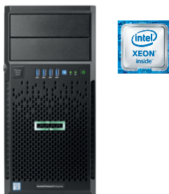
ProLiant ML30 Gen9