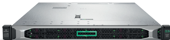
ProLiant DL360 Gen10