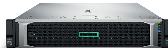
ProLiant DL380 Gen10