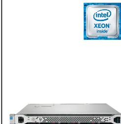
ProLiant DL360 Gen9