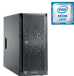
ProLiant ML150 Gen9