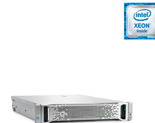
ProLiant DL380 Gen9